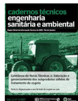
ABES BRASIL REVISTA ESA