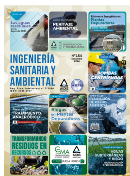
AIDIS ARGENTINA REVISTA ISA