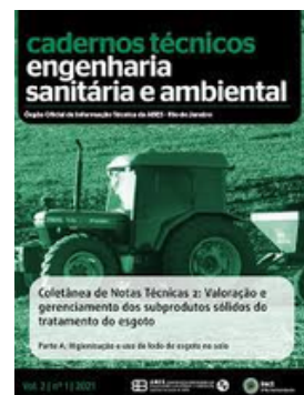
ABES BRASIL REVISTA ESA