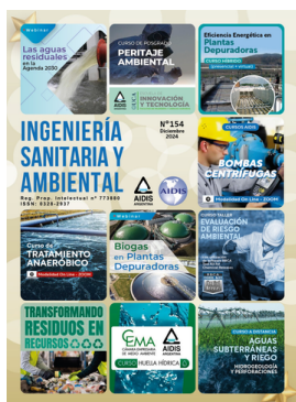
AIDIS ARGENTINA REVISTA ISA