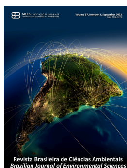
ABES BRASIL REVISTA DE CIÊNCIAS AMBIENTAIS