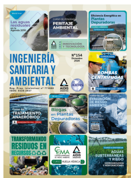
AIDIS ARGENTINA REVISTA ISA