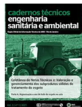
ABES BRASIL REVISTA ESA