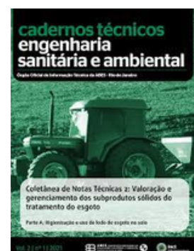
ABES BRASIL REVISTA ESA