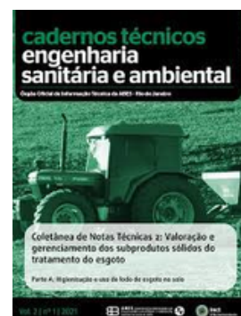
ABES BRASIL REVISTA DE BIO