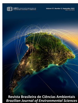
ABES BRASIL REVISTA DE CIÊNCIAS AMBIENTAIS