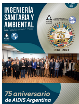
AIDIS ARGENTINA REVISTA ISA