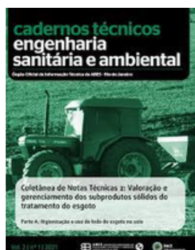
ABES BRASIL REVISTA ESA