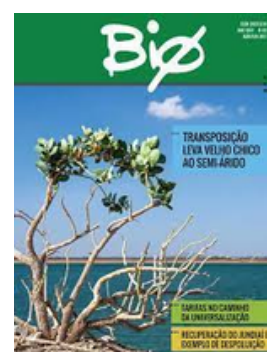
ABES BRASIL REVISTA BIO