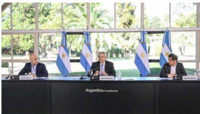
Conferencia de prensa 26 de junio

Evitar la relajación de las medidas de seguridad adoptadas en aquellas actividades que se van liberando de la cuarentena.