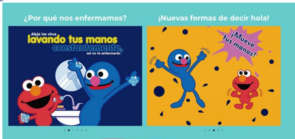
Promocional de la Secretaría de Salud