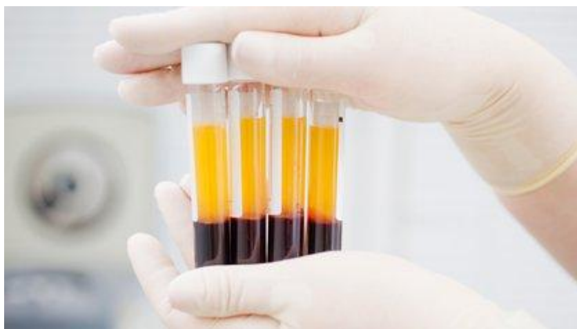
El plasma de personas recuperados como insumo para tratamiento.

Evitar la relajación de las medidas de seguridad adoptadas en aquellas actividades que se van liberando de la cuarentena.