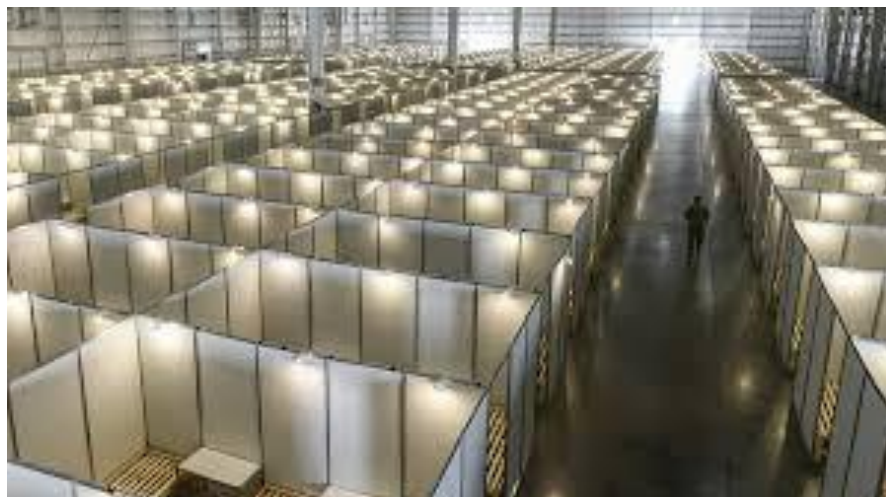
Acondicionamiento hospitalario en la feria Tecnópolis para 2452 camas

Reforzar en las prestatarias de agua y saneamiento en todo el país, la importancia de sus trabajadores y de la necesidad de contar y cumplir con los protocolos de bioseguridad. Fortalecer a las prestatarias para su rol en la promoción de la salud a escala municipal.