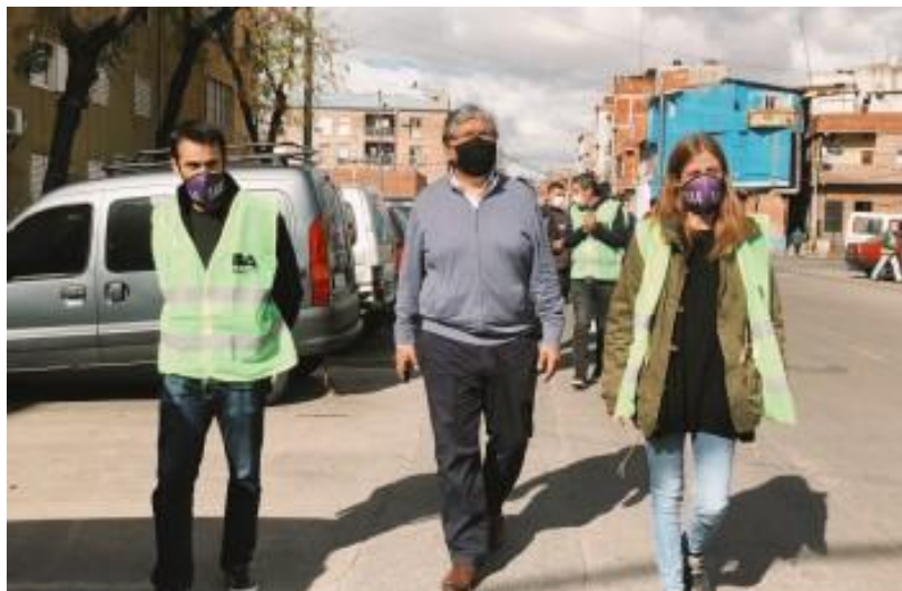
Recorrida por Barrio Popular 21-24

Evitar la relajación de las medidas de seguridad adoptadas en aquellas actividades que se van liberando de la cuarentena.