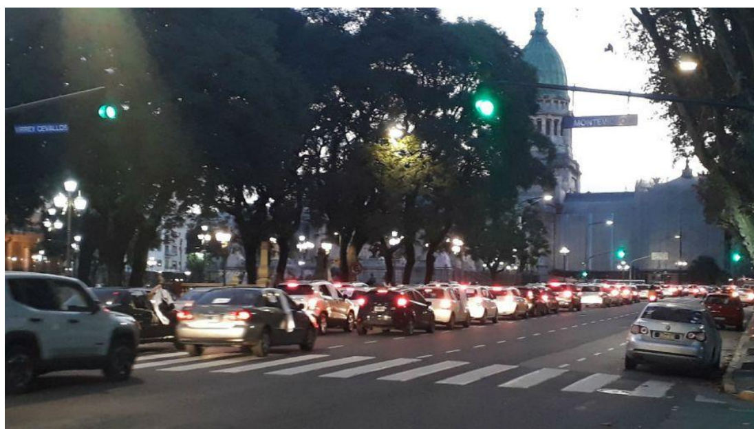
Marcha en contra de la cuarentena en la Ciudad de Buenos Aires