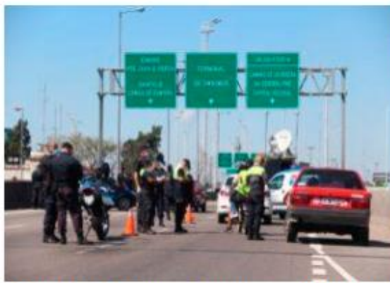
Control vehicular de acceso a la ciudad