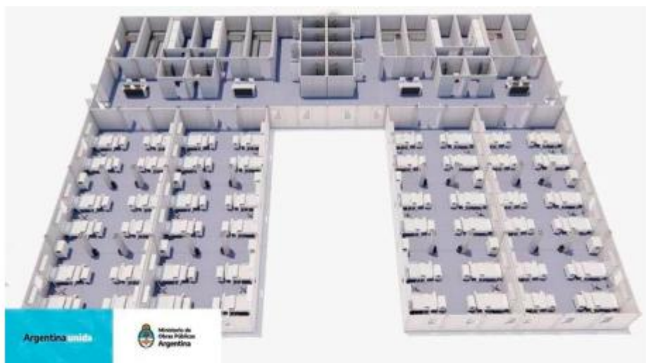
Imagen de los Hospitales Modulares