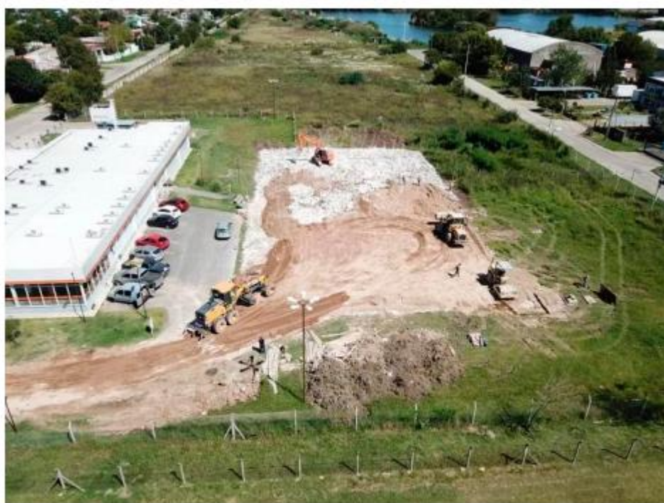
Trabajos en ejecución para instalar un Hospital Modular