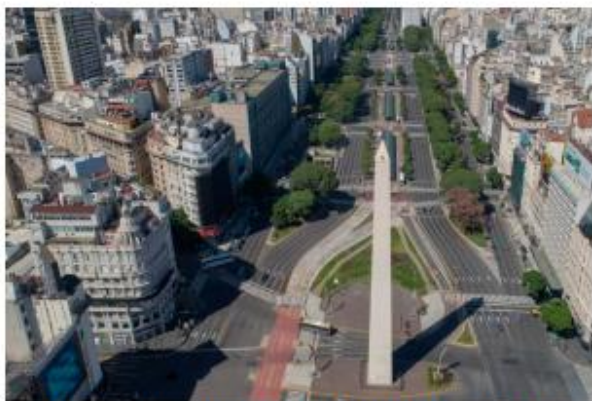
Vista aérea de la Ciudad Autónoma de Buenos Aires (26/03/2020)

Extremar las medidas de aislamiento social, para evitar una explosión de casos de circulación local del virus.