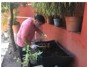
Proceso sencillo de vermicomposta en casa